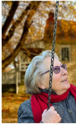
População global está envelhecendo rapidamente

Pessoas estão vivendo mais e tendo cada vez menos filhos